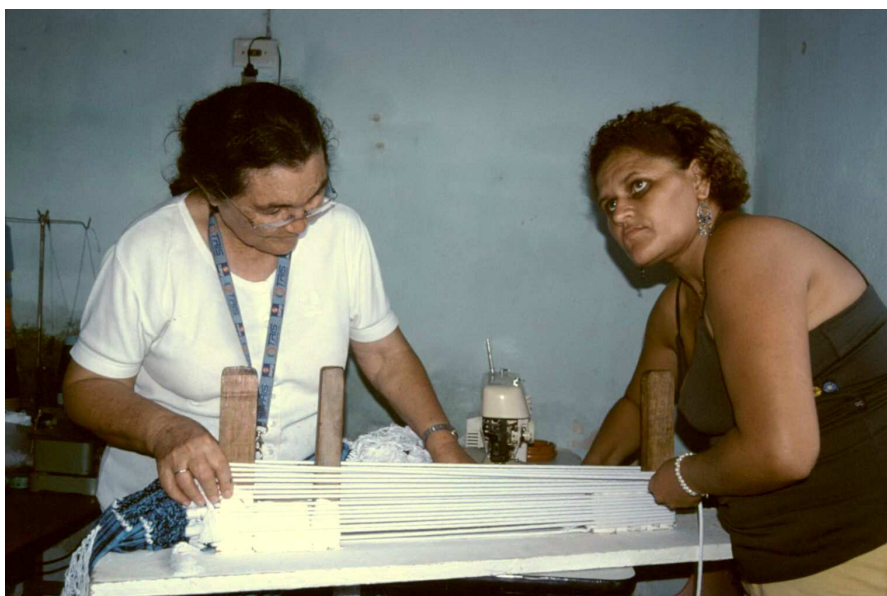
Installation des cordes qui vont permettre de suspendre le hamac.