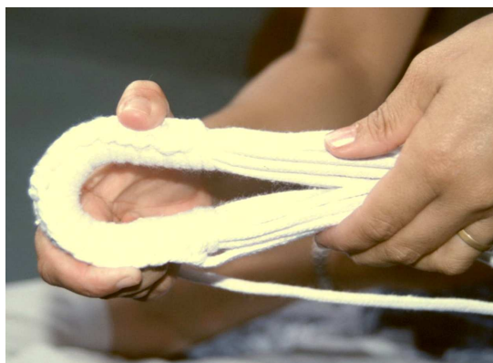
Confection d'un nœud solide pour crocher le hamac