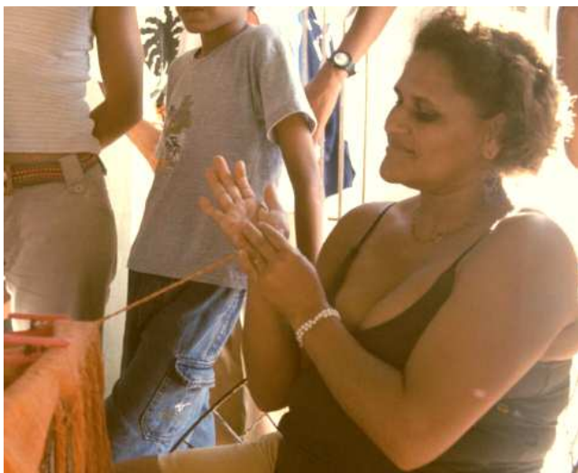
Détissage des bords du tissu Confection de cordons avec les fils de chaîne