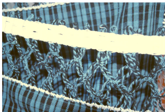
Tissage d'une bande permettant de solidifier les bords et former des bandes